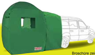
Broschüre zeigt Demonstrationsbilder

YATOO® - Das steht für eine Bettausstattung , ein Kleinküchenensemble und einen Lebensraum .