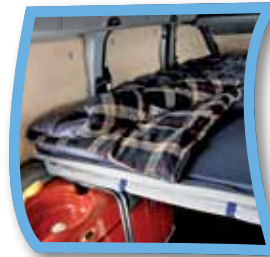
LIDOO® - DIE BETTAUSSTATTUNG

SICH PASSEND ZUM PERSÖNLICHEN BEDARF INDIVIDUELL UND DIFFERENZIIERT AUSSTATTEN Ausrüstungsmodule, die separat nutzbar sind und den europäischen Normen entsprechen, vom unabhängigen Gutachterbüro VERITAS zertifiziert!