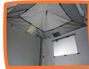
TIPOO® - DER LEBENSRAUM

YATOO® eine Erfindung von ADHOC EQUIPEMENTS (patentierte Systeme, Marken und Modelle)