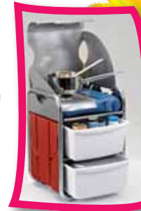
KINOO® - DIE KOCH-EINHEIT