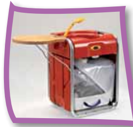
KINOO® - DIE WASCH-EINHEIT